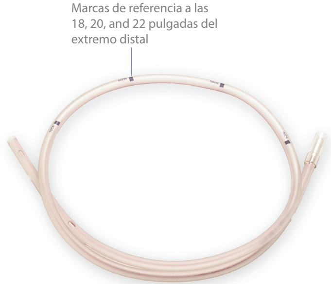
Marcas de referencia a las 18, 20, and 22 pulgadas del extremo distal